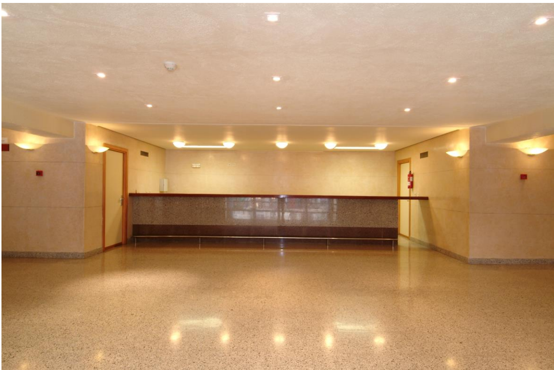
Hall Planta 2