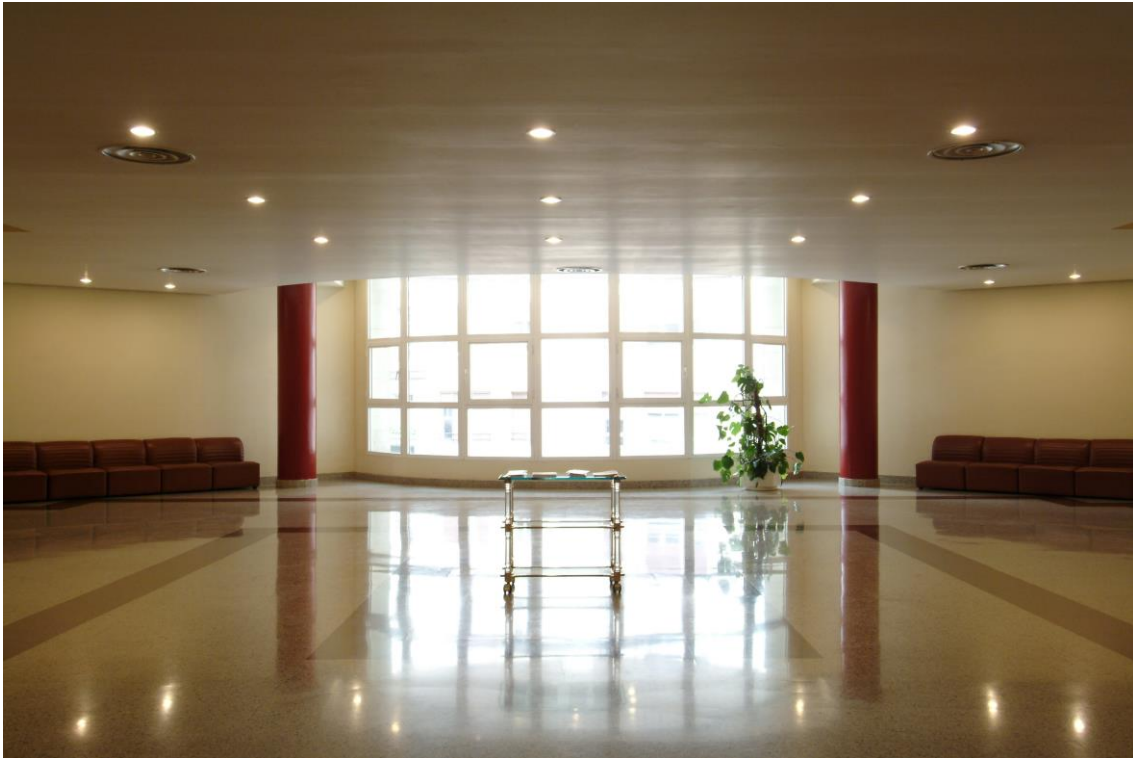
Hall Planta 1